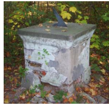
Zegar słoneczny w parku dworskim

Dookoła dworu zachował się park krajobrazowy o powierzchni 2 ha, w którym rosną wiekowe lipy (najstarsza ma ok. 300 lat), klony i platany. W alei podjazdowej zachował się zegar słoneczny z 1836 r. stojący na murowanym postumencie.