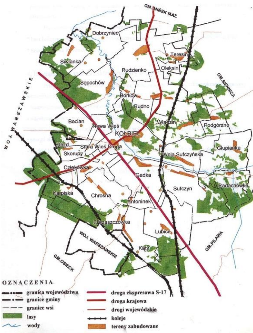
Mapka Gminy Kołbiel

Miejscowość Sufczyn jest jedną z 28 miejscowości wyodrębnionych w podziale administracyjnym Gminy Kołbiel, w powiecie otwockim, sąsiaduje z miejscowościami Gadka, Wola Sufczyńska, Radachówka, Lubice.