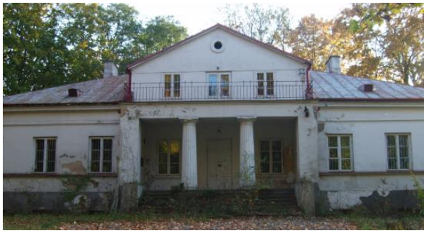
Dwór w Sufczynie